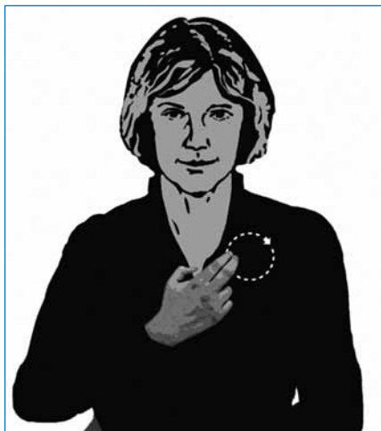
Abbildung 1: Selbstakzeptanzübung (aus: Eschenröder, C. T. & Wilhelm-Göbbling, C. (2012). Energetische Psychotherapie – integrativ (S. 326). Tübingen: dgvt-Verlag)

peutische Vorgehen enthält im Allgemeinen die folgenden Elemente: